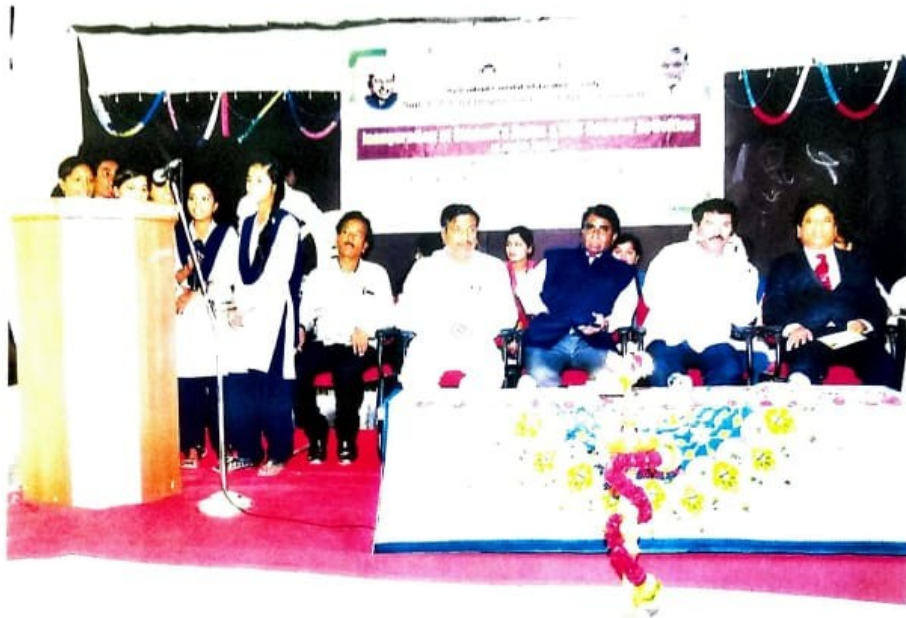
Inauguration by guests