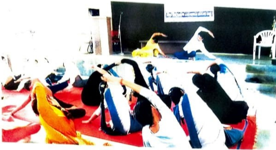
Yoga plus tai chi NSS Special