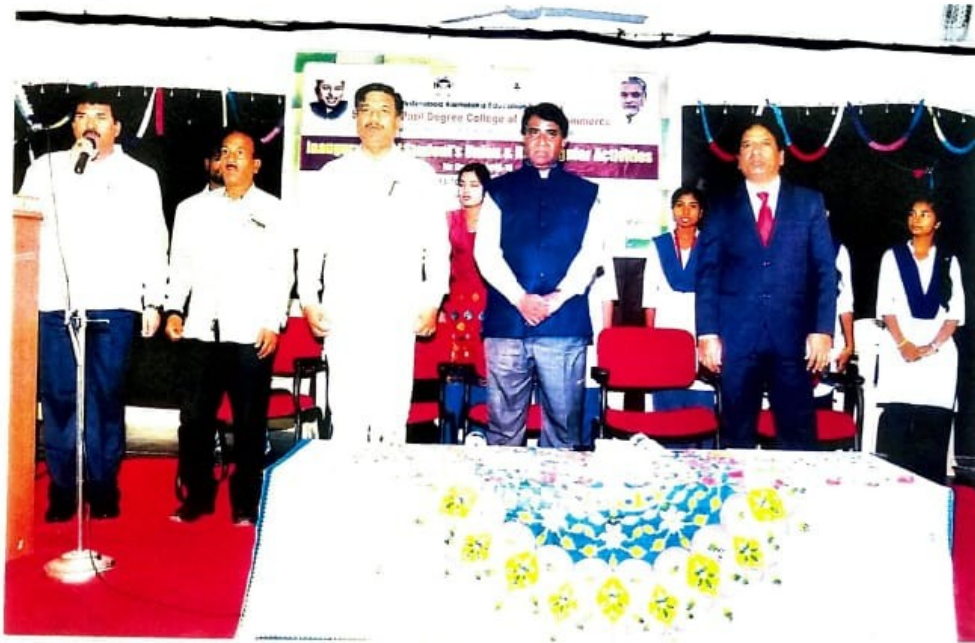
Anchor By Siddhans M Koli