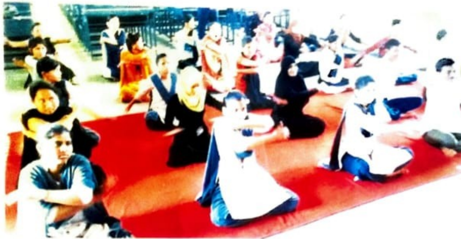
Yoga in NSS special camp